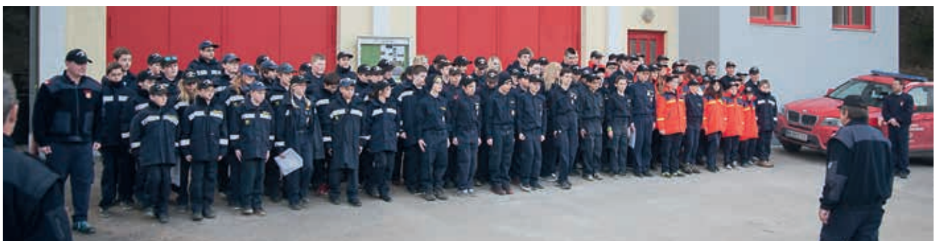
Siegereverkung vor dem FF-Haus in Häusling