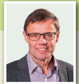
Bürgermeister Franz Penz