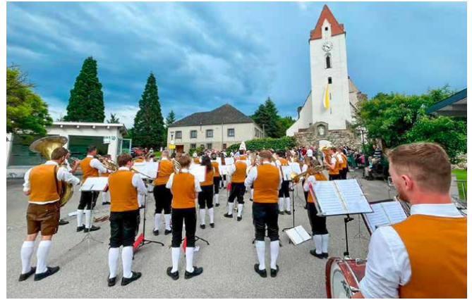
Die Musikkapelle Mauer in voller Stärke.