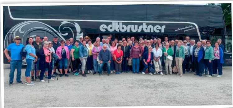
Hochstimmung beim der 2. Tagesfahrt des ÖKB Gerolding nach Schärding.

Eingenommen. Weiter ging es mit einer Führung in der Brauerei Baumgartner mit abschließender Bierverskostung im Braustüberl. Mit einem Abendessen im Gasthof Falkensteiner in Nölling klang der 2. Tagesausflug des ÖKB Gerolding aus.