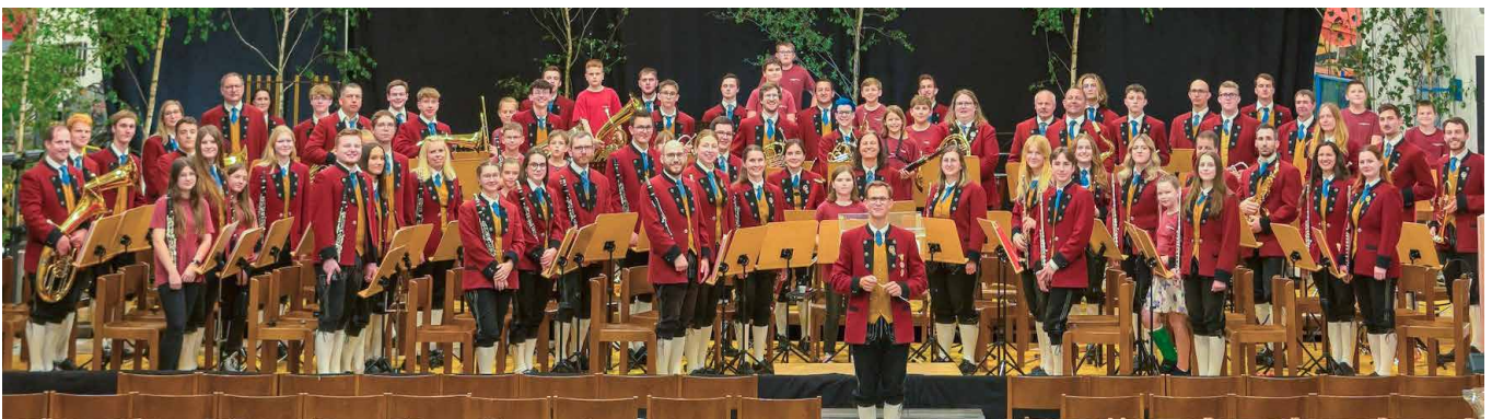
Die MK Mauer beim Tag der Blasmusik in Gerolding.

Wir freuen uns dabei auf euren Besuch und wünschen bis dahin alles Gute! Eure MK Mauer, mit lieben Grüßen Ihr Schriftführer Andreas Wabro