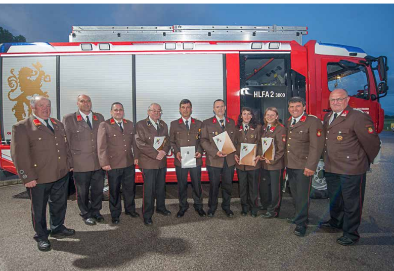
Ausgezeichnete Feuerwehrmitglieder beim Abschnittsfeuerwehrtag in Spielberg-Pielach

Mehr Informationen über unsere Feuerwehr sowie Fotos von den jeweiligen Einsätzen und Übungen finden Sie immer aktuell auf unserer Homepage unter www.ff-haeusling.at .