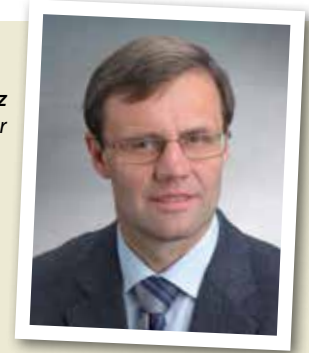
Franz Penz Bürgermeister