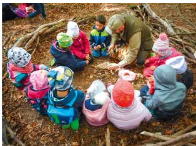
Waldtag September 2019

Montag – Donnerstag 6:45– 17:00 Freitag von 6:45– 15:00.