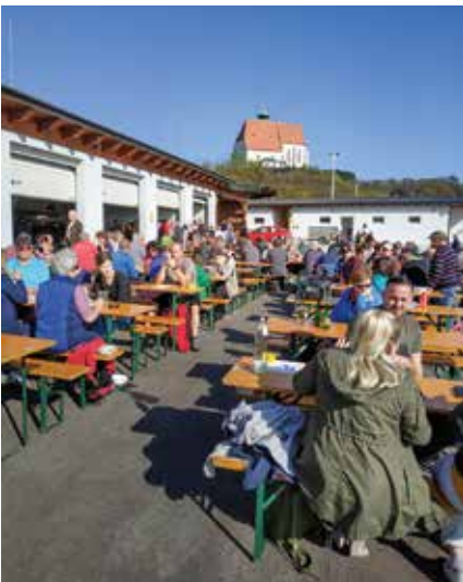
Knödelwandertag des ÖKB Gerolding

Auch heuer veranstalteten wir wieder am Nationalfeiertag unseren Knödelwandertag. Bei Fleischknödel, Grammelknödel, Germknödel und viel Sonnenschein konnten wir wieder viele begeisterte Wanderfreunde am GVZ Gerolding begrüßen.