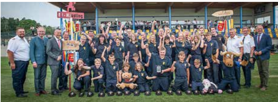
FJ-Bewerbungsgruppen Häusling-Mauer-Mannersdorf und Häusling-Mauer Gerolding beim Landestreffen in Mank

Die Bewerbungsgruppen der Aktiven – Häusling 1 und Häusling 2 – waren im Jahr 2019 bei insgesamt 13 Bewerbungen am Start (5 Leistungsbewerbe, 4 Kuppelbewerbe und 4 Nassbewerbe). Mit