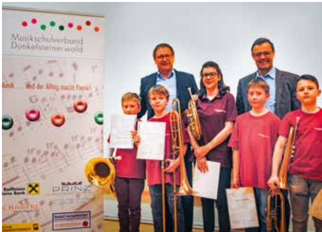
Erfolgreiche Musikschüler des MSV – Dunkelsteinerwald beim Niederösterreichischen Landeswettbewerb „Prima la musica“

Gerade in der heutigen Zeit, ist es unsere Aufgabe die musikalische Bildung unsere Kinder und Jugendlichen positiv, in ihrer sozialen Entwicklung, zu unterstützen.