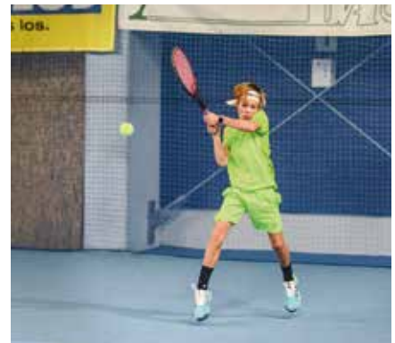
Schnappschuss vom ÖTV-Tennisjugendturnier in der Melker Tennishalle