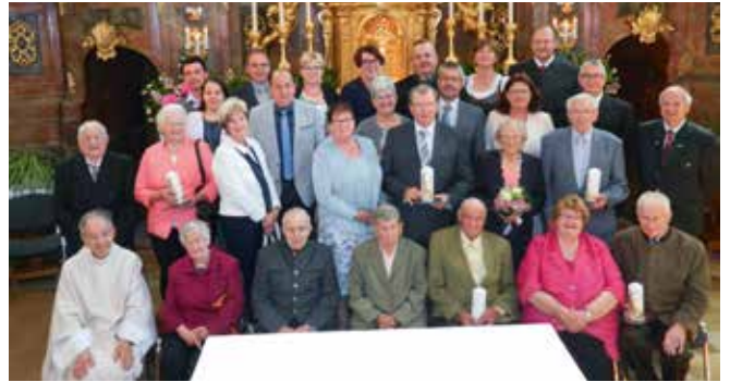
Hochzeitsjubiläumsmesse der Pfarren Gerolding und Mauer, 2. Juni 2019

In der Pfarrgemeinderatssitzung am 20. November 2019 wurde darüber ausführlich beraten und als erste Veränderung die Verlegung der Gottesdienst-Beginnzeit am Sonntag von derzeit 09.15 Uhr auf 10.00 Uhr beschlossen. Bei besonderen Festen im Kirchenjahr wird es eine frühere