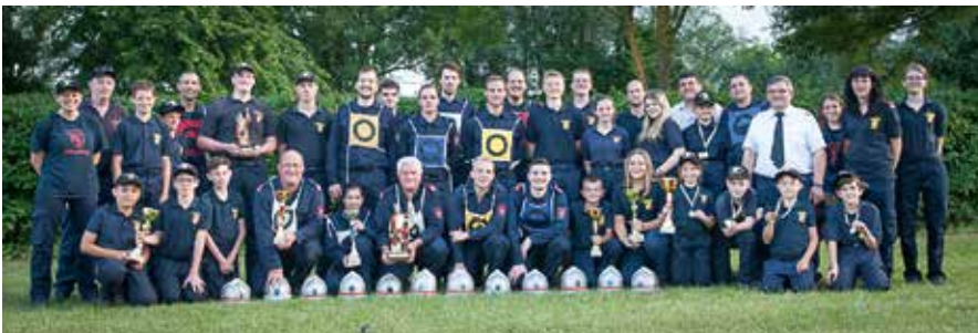
Bewerbungsgruppen Häusling1 und Häusling 2 sowie Bewerbungsgruppen der Feuerwehrjugend beim Abschnittsfeuerwehrleistungsbewerb in Albrechtsberg