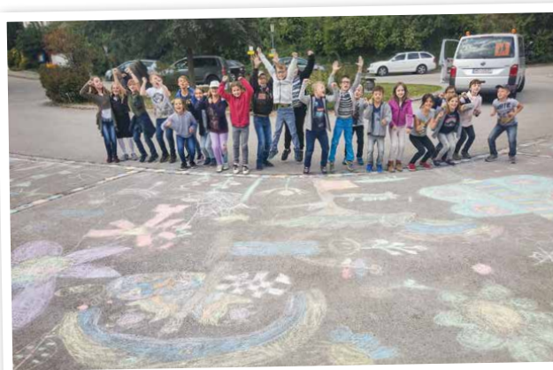
Im Rahmen der Teilnahme an der Europäischen Mobilitätswoche brachte die VS Dunkelsteinerwald in Gerolding die Straßen zum Erblühen.