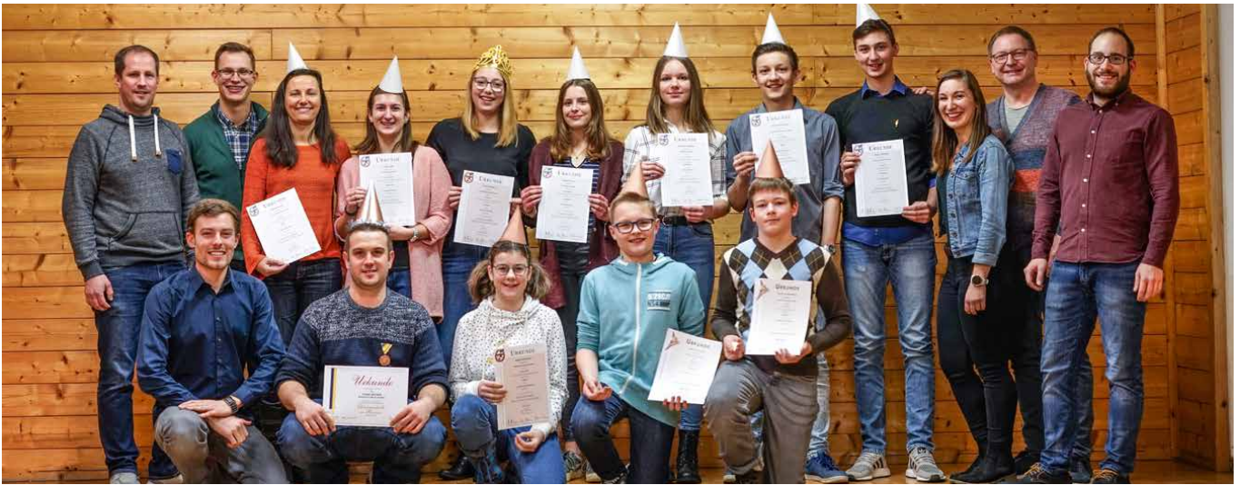
Leistungsabzeichen-Verleihung beim Jahresabschlussfest

Jugend an ihrer Musikalität arbeitet. Neben den ersten Sound-Shake Meetings verbrachten wir unseren allerersten „ Musiker-Brunch “ – gewissermaßen ein gemeinschaftliches Frühstück, um die anderen KollegInnen auch mal in ihrer frühmorgendlichen Aufmachung zu bestaunen. Lustig wars, und umso schöner, wenn soviele Leute trotz all der Proben dabei mitmachen!