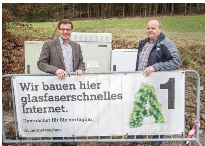
A1 baut Leistungsnetz aus

A1 hat sich im Rahmen der öffentlichen Ausschreibung des Bundes durchgesetzt und erweitert das Breitbandnetz in Dunkelsteinerwald. Durch den geförderten Ausbau erhalten rund 560 Haushalte glasfaserschnelles