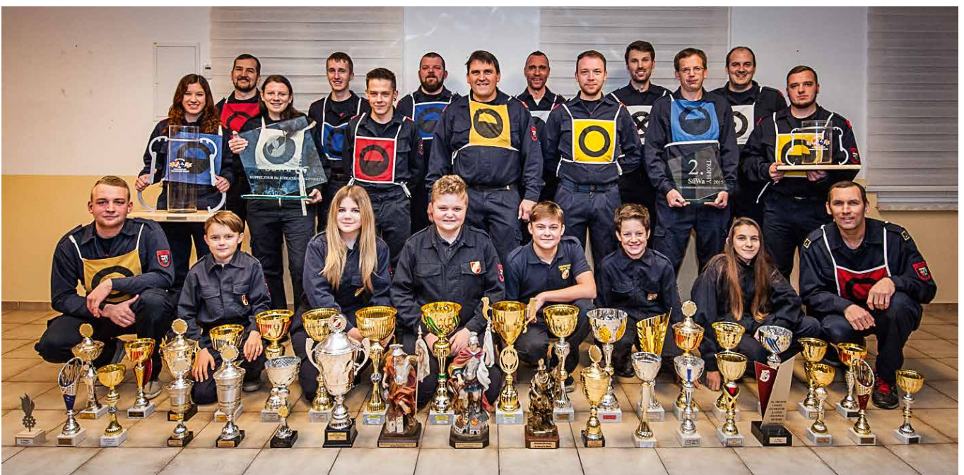
Bewerbungsgruppen der FF Häusling mit den im Jahr 2018 gewonnenen Pokalen