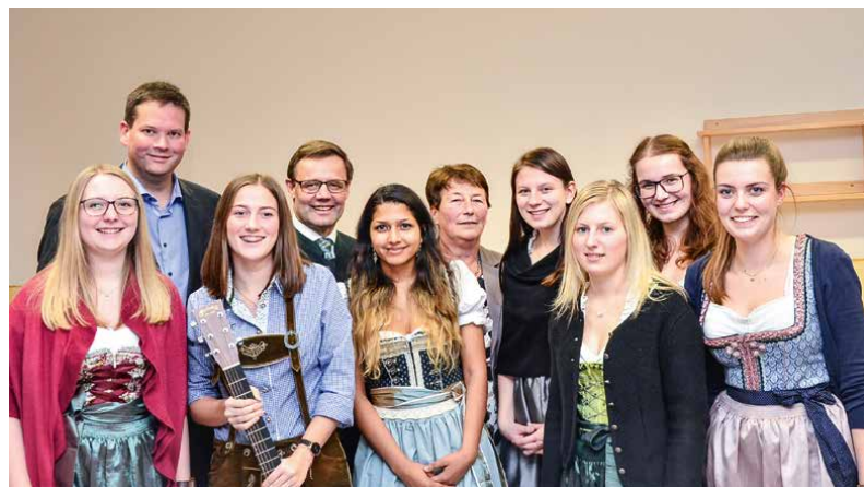
Der erst neu gegründete Chor „Herzklang“ aus der Gemeinde sorgte für Stimmung und musikalische Umrahmung.

Im Programmpunkt „Wir sind Gemeinde“ wurde über das durchgeführte Entwicklungskonzept, das als Bürgerbeteiligungsprozess im Vorjahr abgeschlossen werden konnte, berichtet. Man verwies auf wesentliche Wegmarkierungen der zukünftigen Arbeit. Dazu gehören vor allem eine bessere Schul- und Vereinskoooperation. Zu den Themen Mobilität, Absicherung der ärztlichen Versorgung und Naturpark Dunkelsteinerwald wurden konkrete Arbeitsschritte angekündigt. Die Überarbeitung des Flächenwidmungsplanes konnte ebenfalls abgeschlossen werden. Aufgrund der Struktur ist aber speziell in unserer Gemeinde Dunkelsteinerwald, eine gute