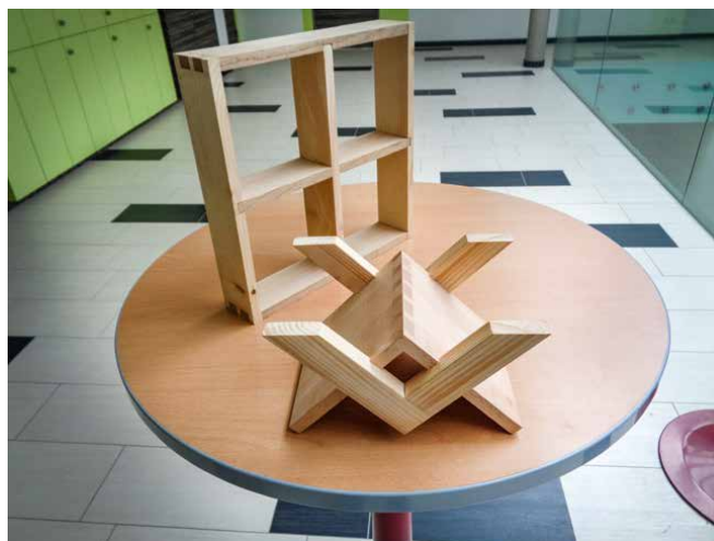
Im Bild zwei Werkstücke von früheren Bundeswettbewerben.

Freitag 14.6. beginnt der Wettbewerb um 8.00 Uhr, die Schülerinnen und Schüler haben dann vier Stunden Zeit um das wirklich anspruchsvolle Wettbewerbs-Werkstück (Zinkenverbindungen usw.) zu fertigen. Als Rahmenpro-