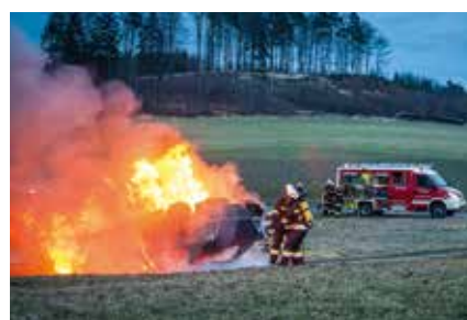
Gemeinsame Übung der FF-Häusling mit der FF-Weyersdorf