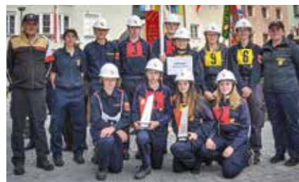
FJ-Bewerbsgruppe Häusling-Mauer-Mannersdorf beim Landestreffen in Rattenberg in Tirol