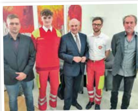
Pröll dankt seinen Rettern

Bei den Wachauer-Radtagen am 14. 7. hatten wir die Aufgabe, den verunfallten LH a.D. Erwin Pröll von Maria Langegg ins Krankenhaus Krems zu bringen. Als Dankeschön gab es nach seiner Genesung im November eine Einladung in sein Büro in Wien und eine Geldspende.