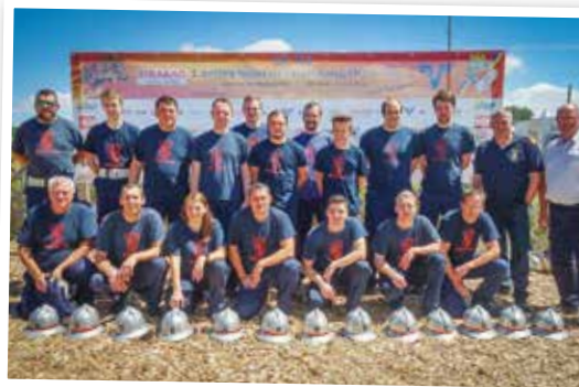
Bewerbsgruppen Häusling 1 und Häusling 2 beim Landesbewerb in Gastern