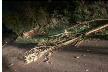
Hier besteht keine unmittelbare Gefahr und auch keine Notfallsituation.

situation ist. Er wird dann jemanden aus der FF anrufen (derjenige wird sich um die Beseitigung kümmern), und keinen Alarm auslösen.