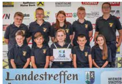
FJ-Bewerbsgruppe Häusling-Mauer-Gerolding beim Landestreffen in St. Aegyd