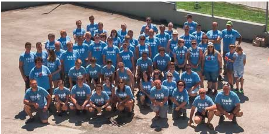
Die „Mann/Frauschaft“ beim IRONMAN

Ich bedanke mich besonders bei allen Helfern, denn deren Leistungen waren wirklich hervorragend. Es macht auch Spaß bei einem Fest mit so guter Stimmung und gutem Besuch, mitzuarbeiten.