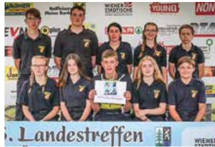
FJ-Bewerbsgruppe Häusling-Mauer-Mannersdorf beim Landestreffen in St. Aegyd