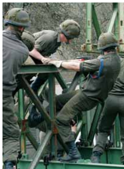
Die Bedeutung der Pioniere in Melk machte sich gerade bei Katastropheneinsätzen bemerkbar.