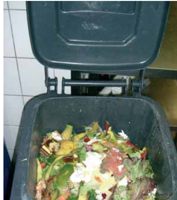
Küchenabfälle werden optimalerweise in der Bio-Tonne entsorgt.

und abfallwirtschaftlichen Überlegungen möglichst vermieden werden. Durch die Ableitung biogener Abfälle in die Kanalisation wird die Belastung der Kläranlagen erhöht. Die Folge sind steigende Betriebskosten auf der Kläranlage und eine erhöhte Gewässerbelastung. Fettablagerungen in den Kanälen können zu erhöhtem Wartungsaufwand führen. Nebenbei wird beim Wegspülen der Abfälle auch unnötig Trinkwasser verbraucht. Wesentlich umweltgerechter ist daher die Sammlung biogener Abfälle (Biotonne) im Rahmen der Mülltrennung. ■